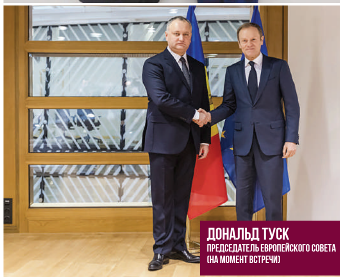
ДОНАЛЬД ТУСК ПРЕДСЕДАТЕЛЬ ЕВРОПЕЙСКОГО СОВЕТА (НА МОМЕНТ ВСТРЕЧИ)