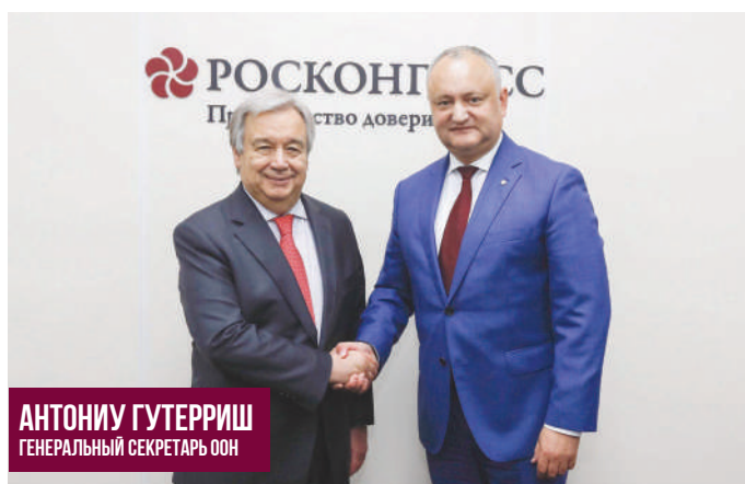
АНТОНИУ ГУТЕРРИШ ГЕНЕРАЛЬНЫЙ СЕКРЕТАРЬ ООН